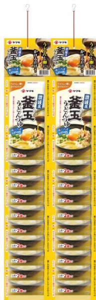
※ 「釜玉うどん」認知度 17年ヤマキ調べ