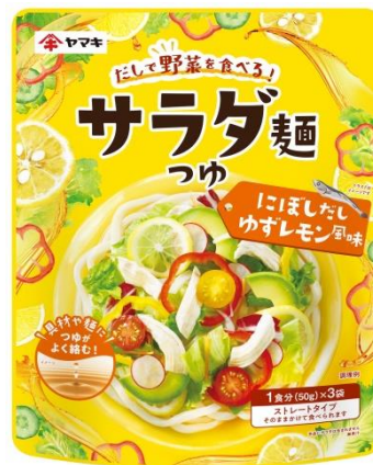
にぼしだしゆずレモン風味

在宅勤務をする方が増える中、自宅で昼食をとる機会が増えています。特に在宅勤務者の場合、限られた休憩時間で昼食を取る必要があるため、手軽さ、簡便さという点から、昼食に麺類を食べる機会が増えたという人が半数以上を占めています。一方で、昼食に関する悩みとして、野菜不足や栄養の偏りを気にするという意見があがっており、パウチつゆだけでは物足りなさを感じている人が8割にのぼります。