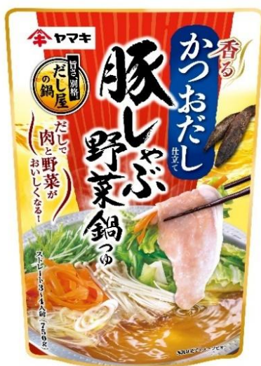
豚しゃぶ野菜鍋つゆかつお 750g

今回のリニューアルでは、だしの風味を向上し、肉や野菜のおいしさをより引き立てる味わいに仕上げました。また、シリーズ全体でパッケージデザインを見直し、商品の魅力をより分かりやすく伝えます。