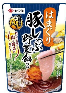
豚しゃぶ野菜鍋つゆ はまぐり 750g