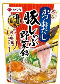
豚しゃぶ野菜鍋つゆ かつお 750g