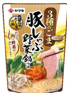
豚しゃぶ野菜鍋つゆ 3種のごま 750g