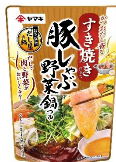
豚しゃぶ野菜鍋つゆ すき焼き仕立て 750g

ヤマキは、「鰹節屋・だし屋、ヤマキ。」として鰹節とだしを通じて、「おいしさ」と「健康」、そして「食文化の継承・食資源の持続性確保」に貢献してまいります。