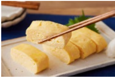
白だし だし巻き卵