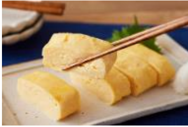
白だし だし巻き卵