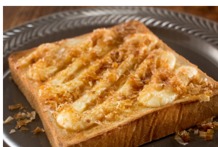
かつまヨトースト

ヤマキいちおしの「かつまヨトースト」、意外なおいしさの「かつお節アイス」など様々なメニューが取り上げられています。