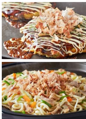
■かつお節使用メニュー