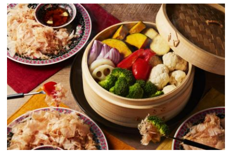
蒸し野菜の花ふわりフォンデュ