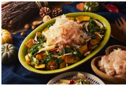
きのこのペンネサラダ