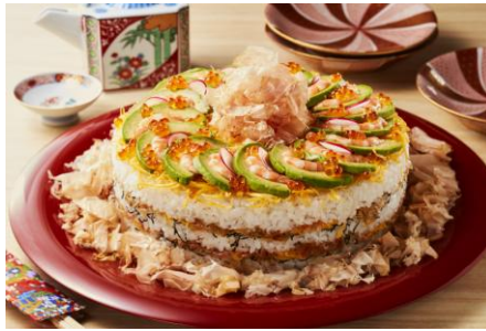
ミルフィーユちらし寿司