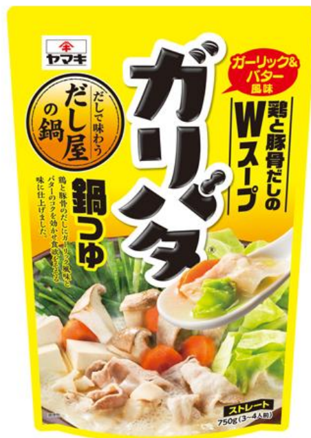
■クックパッドたべみる