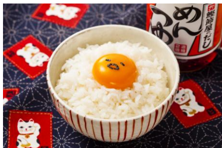
たまごかけごはん

また、今後は店頭でも、「ぐでたま」メニューが簡単に作れるレシピリーフレットを配布予定です。