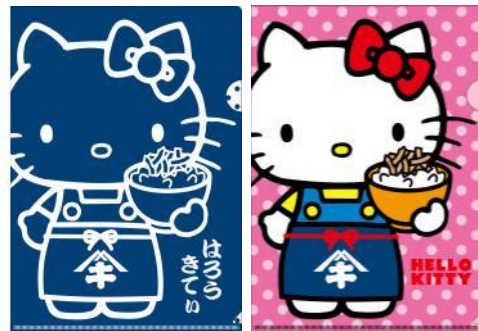
サイズ：約 310mm×220mm (A4 サイズ用) 材質：PP